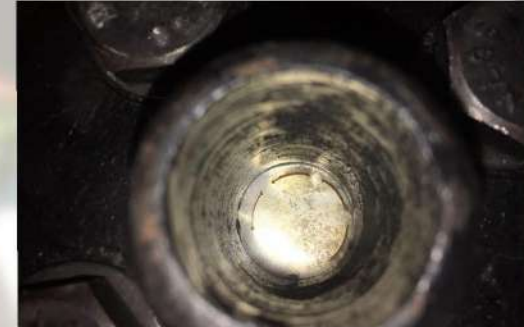
نصب رایچر دیسک روی دستگاه تست

انجام تست های اولیه و تحلیل نتایج بعد از آماده سازی رایچر دیسک ها توسط دستگاه های ساخته شده مورد تست قرار می گیرند و نتایج حاصل از تست ها توسط تیم فنی به صورت دقیق بررسی و تحلیل می شود.